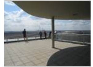
Blick auf den Tagebau Nochten

Die Braunkohlenplanung ist in den Landesplanungsgesetzen der betroffenen Länder Nordrhein-Westfalen, Brandenburg und Sachsen rechtlich verankert. Dort werden u.a. Regelungen zur Abgrenzung von Braunkohlenplangebiet und zu den Inhalten der aufzustellenden Braunkohlenpläne getroffen.